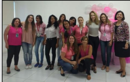
Mulheres da Trino Frio.

O dia 08 de março é oficialmente celebrado o Dia Internacional das Mulheres . Dizem que o dia das mulheres são os 365 dias do ano, e isso é verdade! Sempre é um bom momento para homenageá-las. A sua força e determinação mescladas com a delicadeza e sensibilidade fazem das mulheres pessoas muito especiais. O Grupo Trino promoveu nesse dia uma homenagem para todas as mulheres da empresa, onde colegas de trabalho realizaram depoimentos sobre elas, além de ter ocorrido palestras, workshop de maquiagem e entrega de brindes.